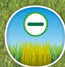
Tolerancia a enfermedades