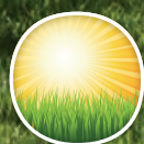
Tolerancia al calor