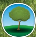
Tolerancia a la sombra