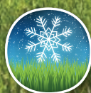
Tolerancia al frío