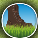
Tolerancia al pisoteo