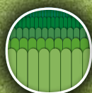
Alta densidad de plantas