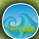
Tolerancia a la salinidad